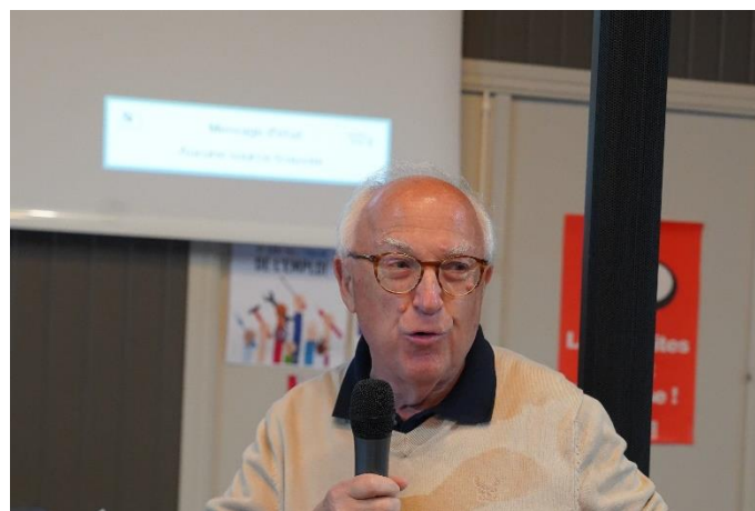
Délégué régional Centre Val de Loire