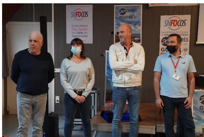
Délégués régionaux PACA