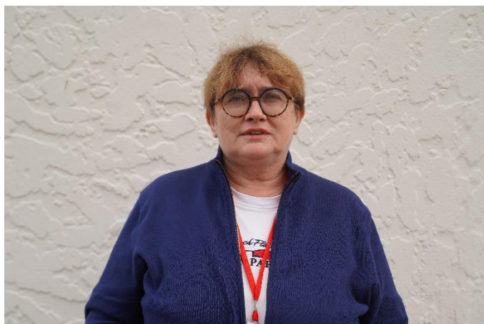
Déléguée Régionale Occitanie