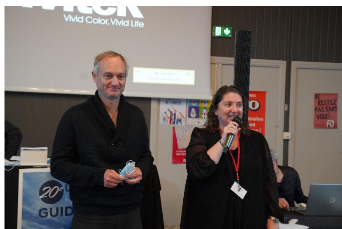
Délégués régionaux Aquitaine