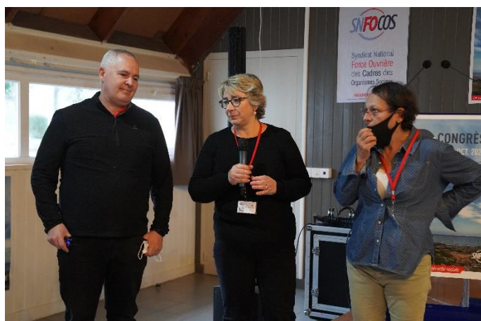
Délégués régionaux IDF