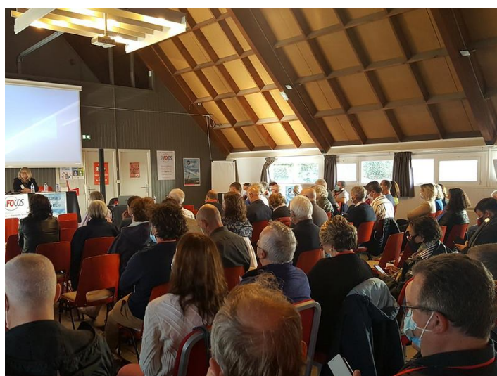
Assemblée du Congrès

Retrouvez plus de photos sur notre compte Flickr