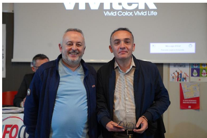
Délégués régionaux Grand Est